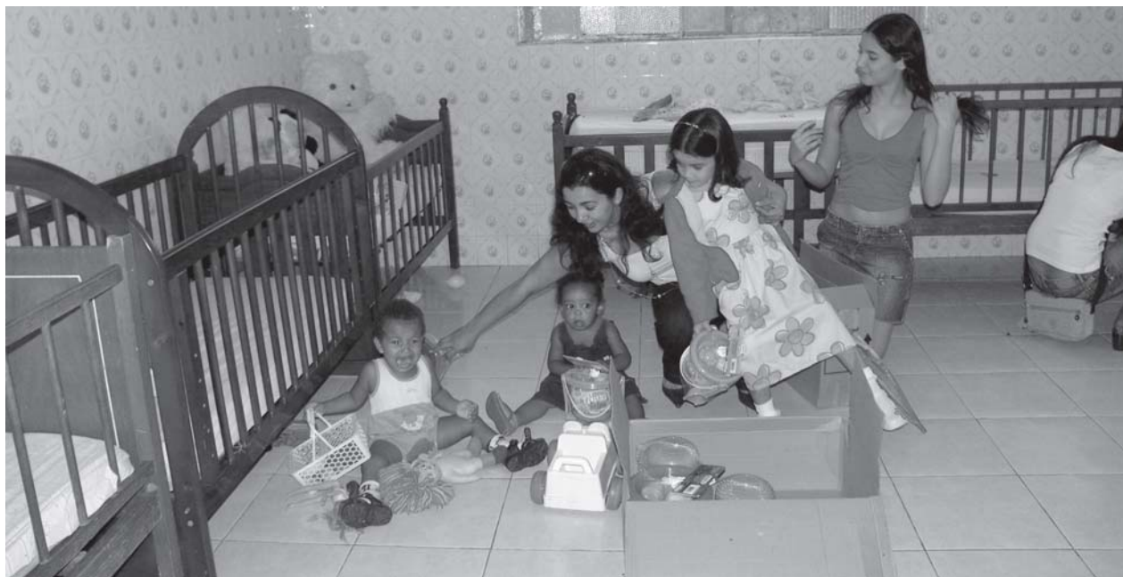
A Associação de Proteção às Crianças Pobres, foi uma das entidades beneficiadas

da era geral. Com a algazarra que faziam, demonstravam a satisfação e a gratidão por serem lembradas, e contagiavam os que estavam por perto, como os coordenadores dessas entidades, que se emocionaram ao ver a alegria espontânea das crianças.