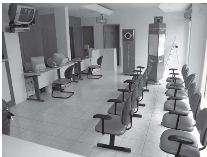
O ambiente moderno oferece todo conforto para os clientes